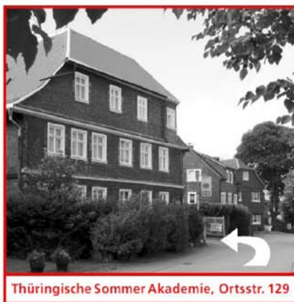
Thüringische Sommer Akademie, Ortsstr. 129

links ab Richtung Masserberg (Kreisverkehr nochmal links!) > nach ca 2 km wieder links ab über Waffenrod, Fehrenbach nach Masserberg > weiter bis Neustadt a. Rennsteig > dort Richtung Großbreitenbach > nach ca 3 km die 2. links ab (direkt vor Hotel "Hohe Tanne") Richtung Herschdorf > in Gillersdorf rechts ab nach Böhlen > im Ort die erste Straße gleich nach der Engstelle (Ampel!) rechts ab > ca. 100 m links Ankunft in der Ortsstraße 129.